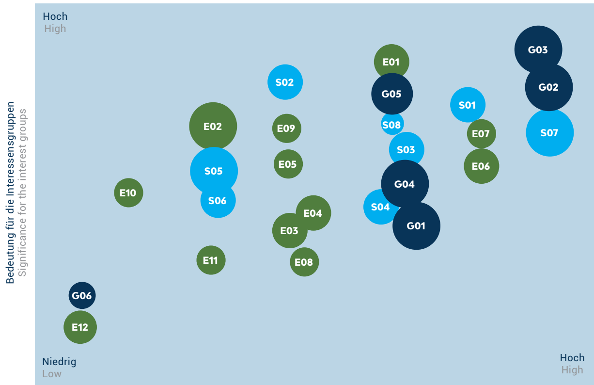
Bedeutung für den langfristigen Unternehmenserfolg Significance for the long-term success of the company